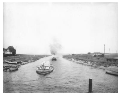
Slæbebåd med pram på vej gennem kanalen ved Karrebæksminde.

Den 11. september 1812 var der en del røre i Næstved, for denne dag blev Den Danneskjoldske Kanal indviet.