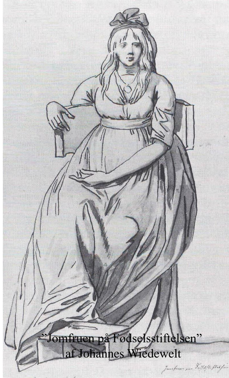
”Jomfruen på Fødselsstiftelsen” af Johannes Wiedewelt